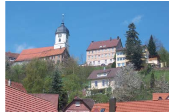
Historische Altstadt Altensteig