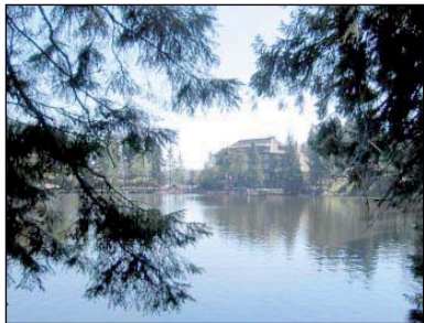
Mummelsee mit Hotel

Unsere Region bietet viele interessante Ausflugsmöglichkeiten wie z.B. die Nagoldtalsperre mit Bade- und Surfmöglichkeiten, den Barfußpark in Hallwangen, einen Fischteich zum Angeln im Zinsbachtal, viele ausgezeichnete Nordic Walkingstrecken , eine Kamelfarm ... und vieles mehr.