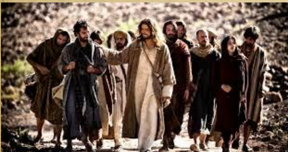
Jesus war die meiste Zeit mit Männern unterwegs

Männer möchten gerne erlöste Männer sein. Ihr Leiden aber ist diffus - sie wissen gar nicht, woran sie leiden. Da sind heimliche Unbeweglichkeiten, emotionale Einschränkungen, seltsame innere Spannungen, mangelnde Lebenslust und wenig Freunde. Alles Ungereinigte drückt irgendwann im Bereich Sexualität durch, wo sie dann offen zugeben: Da haben wir ein Problem. Die moderne Initiationsforschung kennt sich bestens in Männerherzen aus - und dennoch, es ist für einen Mann nicht so leicht, an seine Wunden heranzukommen. Er braucht Freunde, die ihm bei seiner Transformation helfen. Um diese Zusammenhänge zwischen Individualität und Bruderschaft wusste Jesus, wussten die Ordensgründer, wussten die Brüderbewegungen. Jesus selbst gründete und leitete eine dreijährige Männergruppe und ging einen Weg mit ihnen über viele Stationen bis zu seinem Kreuz - sie waren nicht alleine unterwegs. Männer leben und verändern sich „im Rudel“ - Isolation ist vom Bösen. Viele Männer geben heute zu, dass sie keine Freunde mehr haben und dass sie nicht mehr so einsam leben möchten wie ihre Väter.